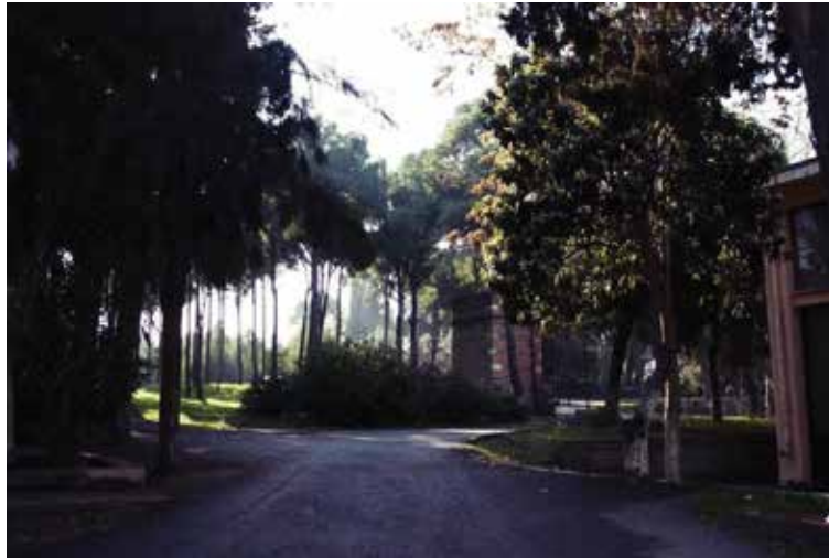
Figür 9 Koru ve Güvercinlik (Bornova Anadolu Lisesi Facebook Grubu).