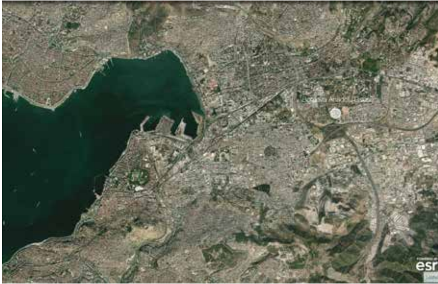
Figür 1 İzmir Bornova Anadolu Lisesi yeri ( https://mapmaker.nationalgeographic.org ).

Kozmopolitan, genel olarak kentler için çeşitli ulusları içinde barındıran anlamıyla öne çıkar (TDK). Osmanlı İmparatorluğu Dönemi'nde vatandaşlık haklarının tanımlanması amacıyla gayrimüslimler için kullanılmıştır (daha ayrıntılı okumak için Eldem, 2013'e bakınız). Aynı kavram, Merriam Webster Sözlüğünde kişisel deneyimle elde edilen dünya görüşü ve işlenmiş bilgiye sahip olma durumu olarak tanımlanmıştır (Merriam-Webster). Bu tanıma dayanılarak, 20. yüzyıl öncesi dönemde kozmopolitan bireylerin özellikle liman kentlerinde sahip oldukları bilgi ve kaynaklar ışığında kazandıkları kişisel deneyimleri ile birlikte geliştirdikleri dünya görüşleri sonucunda etkiledikleri mekânsal üretimin 20. yüzyıl göz önünde tutularak hem mekânsal hem de kavramsal dönüşümünü ele alınacaktır. Bu yazı, bu nedenle kozmopolitan mekanların günümüzdeki durumuna ve kozmopolitanizmin güncel karşılığına, İzmir Bornova Anadolu Lisesi (BAL) üzerinden odaklanmaktadır.