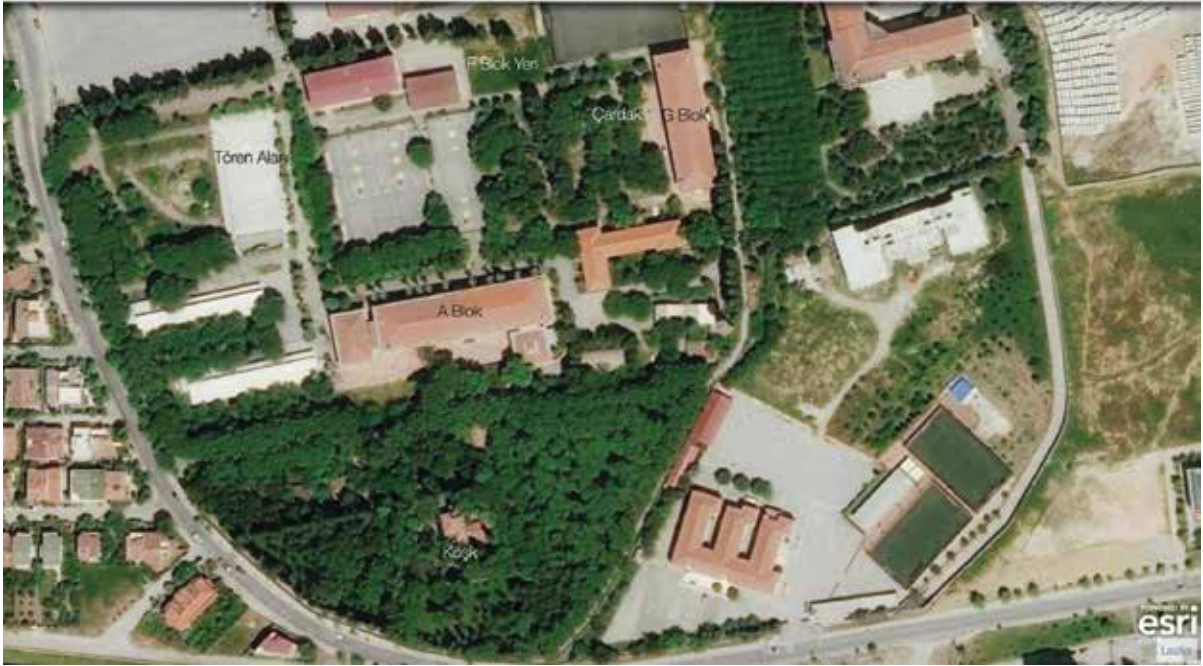
Figür 3 Bornova Anadolu Lisesi içinde yer alan bloklar ve köşk ( https://mapmaker.nationalgeographic.org ).

Kendimi ana bulvar olarak adlandırdığım kilit taşlarla döşeli uzun bir yolda buldum kapıdan geçtikten sonra. Tören alanı sağda yer alıyordu. Dikdörtgen bir planda, her sınıf nizami bir biçimde sıralanmış aynı yöne bakıyordu. Atatürk büstünün yer aldığı yükseltilmiş bir platform üzerinde biraz önce kapıda bekleyen müdürümüz öğrencilere hoş geldiniz konuşması yapmak üzere yerini almıştı. İstiklal Marşı'nın okunmasının ardından sınıflarımızı bulmak üzere tören alanından ayrıldık. Bu alan Cumhuriyet'in kurucusuna saygıyı gösteren bir alan olmasının yanı sıra, Osmanlı İmparatorluğu'nun yıkılmasının ardından kurulan cumhuriyetin ve küllerinden doğan İzmir'in alanlarıyla (Cumhuriyet Meydanı, Gündoğdu Meydanı gibi) eşdeğer nitelikteydi. Bu resmi ve güçlü işlevi, bahar şenliklerinde yerini konserlere bırakıyordu. Bu geçici işlevsel dönüşüm aynı zamanda bizi ve bu alandaki davranışlarımızı da dönüştürüyordu.