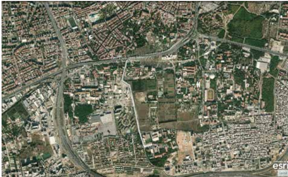
Figür 2 Bornova Tren İstasyonu'ndan Bornova Anadolu Lisesi'ne doğru izlenen yol ( https://mapmaker.nationalgeographic.org ).