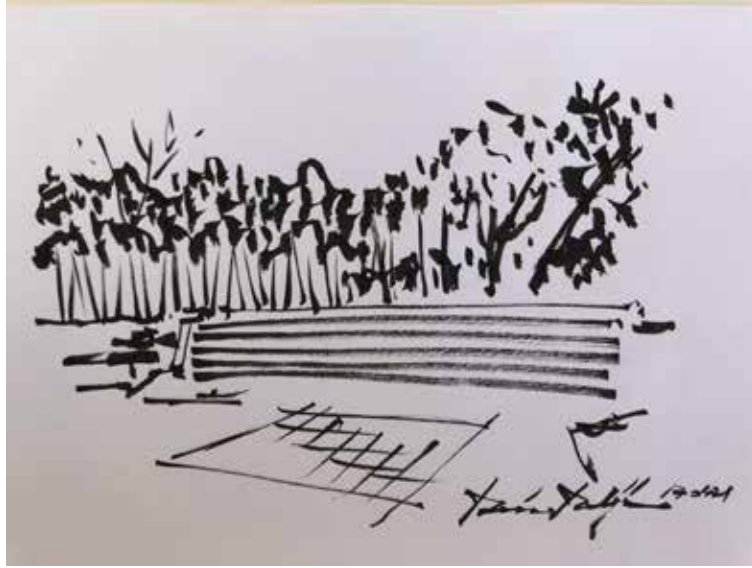
Figür 8 Amfityatro.

Günün ilk yarısını tamamladıktan sonra çalan zille birlikte bu kez uzun koridorun başındaki sınıftan çıkıp öbür ucuna doğru yürüdüm. Merdivenden aşağıya inip kilit taşlarla döşeli bir yolda ilerlemeye başladım. Solumda başka bir blok vardı. F ve G Bloklara göre daha eski, buna karşılık daha heybetli duruyordu. Köşelerindeki taşlar onu daha güçlü gösteriyordu. Bina bittiğinde birçok yolun kesiştiği geniş bir alana geldiğimi anımsıyorum. Sola döndüğüm anda gördüğüm koru, sanıyorum, birkaç saniyeliğine soluğumu kesmişti. Hızlı adımlarla koruya doğru yürümeye başladım. Yavaş yavaş eğim artıyordu. Sanki küçük bir tepeye doğru yol alıyordum. Solumda üç katlı uzun bir yapı yer alıyordu. Onun önünde üst kotla alt kot arasını bağlayan, sahnesinde damalı döşeme olan bir amfityatro vardı. Her adımda yaşadığım karşılaşmalar beni daha çok şaşırtıyor ve heyecanlandırıyordu. Okulun bulunduğu yere aidiyeti beni kendisine hızlıca bağlamıştı.