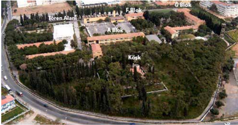
Figür 5 Bornova Anadolu Lisesi hava fotoğrafı.

Törenin ardından G Blok'a doğru yürümeye başladım. Bu sırada yürürken gördüğüm kantin, irili ufaklı ağaçlarla dolu, çakıl taşları ile döşenmiş bir alandı. Birkaç adım sonra karşılaştığım çeşme, doğal kaynakların öğrencilerin temel igereksinimi içerisinde ücretsiz olarak kullanıma sunulduğunu gösteriyordu. Siyahlı beyazlı dere taşlarıyla döşeli yoldan yürümeyi sürdürdüm. Sağımda üstü yalın bir çatı ile örtülü bir oturma yeri vardı. Önümdeki dört yıl boyunca burası birçok kez arkadaşlarımla görmeye gittiğim; ders arasında dinlendiğimiz bir yer oldu. G Blok'a yakın olması nedeniyle de yeğlediğimiz bir yerdi. Buraya çardak diyecektik sonraları; sivil mimari içinde önemli bir yeri vardı çardağın. Farsça dört tarafı çevrili anlamına gelen çârtâk kelimesi Türkçe'ye 14. yüzyılda geçmişti. Balkanlara değin uzanan bir mimari elemana dönüşerek gündelik yaşam içinde özellikle yazları serinlemek amacıyla kullanılan önemli bir mekân olmuş (Bing, 2018), Ege ve Akdeniz Bölgesi'nde ise genellikle asma ile kaplanmıştı. Bu geleneksel mimari elemanın sürekliliği, kuşkusuz yolu okuldan geçmiş öğrencilerin toplumsallaşmasında, birbirlerini tanımada ve aynı kültürü sürdürerek paylaşmasında önemli bir rol oynamıştı.