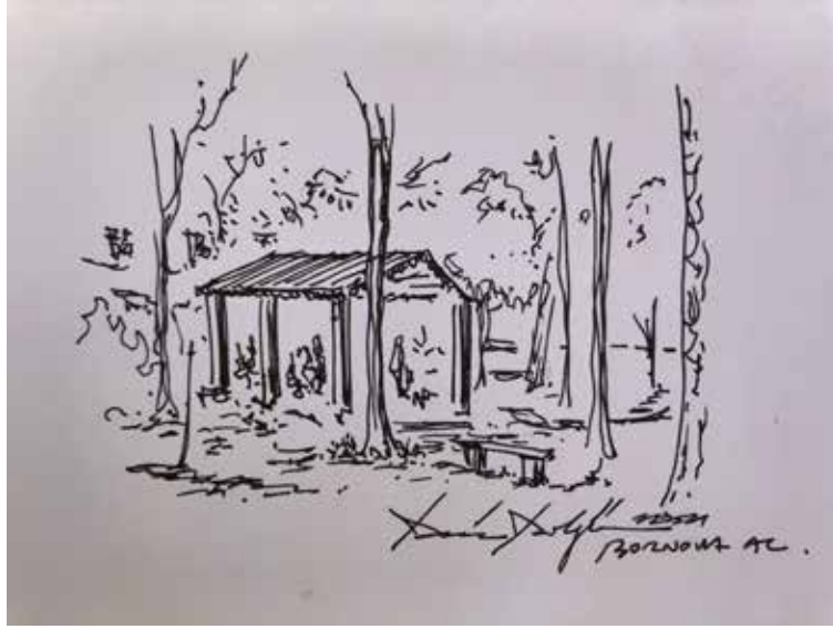
Figür 6 Çardak (Deniz Dokgöz).

G Blok'a yaklaşmıştım. Geniş pencereleri olan üç katlı bir yapıydı. Pencere düzeninden her sınıf birbirinin aynısını yineler biçimde koridor çevresinde dizilmişlerdi görünen. Büyük pencereleriyle gün ışığından ve temiz havadan en üst ölçüde yararlandığı belli oluyordu. Girişin üzerinde cam ile kaplanmış açıklık daha da genişliyordu; merdivenleri görebiliyordum. Beton ve cam, yapı gereçleri olarak ön plana çıkıyordu. Sınıfımın, zeminin bir üst katında yer aldığını biliyordum; yavaşça merdivenlerden çıktım. Sınıflar uzunca bir koridorun sağında dizilmişlerdi; sol yan ise tümüyle pencerelerle kaplıydı. Gri renkli kapıdan 49 numaralı sınıfa girdim. P sınıfıydı. Abecesel dizilen bu sınıflardan P'de olmak yine okulun ölçeğini anımsatıyordu. Okulun penceresinden dışarıya baktım; uzun çam ağaçlarının arasından çardak görünüyordu, yukarıdan bakınca çardağı çevreleyen zeminin toprak olduğunu farkettim. Kayrak taşları ile dar patikalar oluşturulmuştu çardağa ulaşmak için, birisi çeşmeye bağlıyordu; bir başka patika kantine doğru gidiyordu; bir başkası da solda henüz görmediğim bir yere. Çevreye göz gezdirirken; okulun geri kalanını keşfetmek için öğle teneffüsünü ipe çekiyordum.