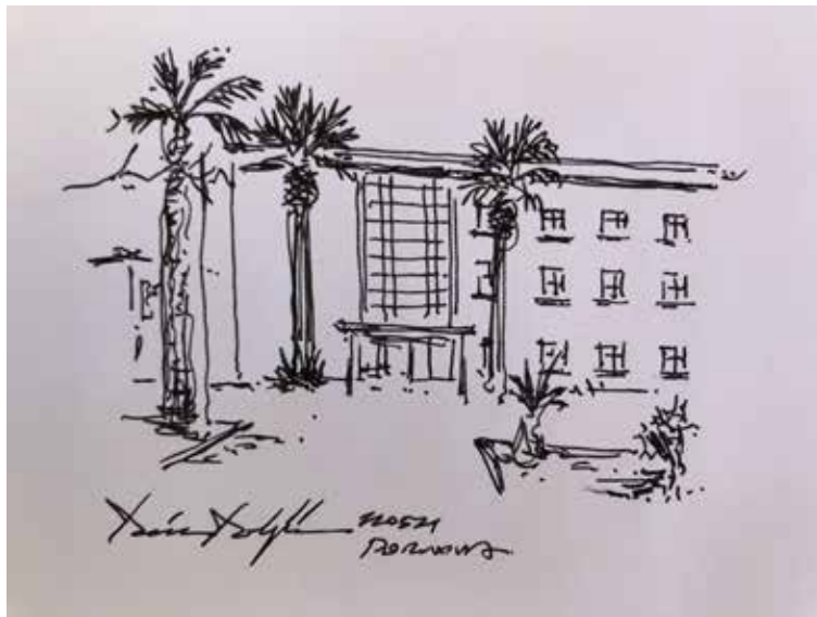
Figür 7 G Blok (Deniz Dokgöz).

G Blok'a yaklaşmıştım. Geniş pencereleri olan üç katlı bir yapıydı. Pencere düzeninden her sınıf birbirinin aynısını yineler biçimde koridor çevresinde dizilmişlerdi görünen. Büyük pencereleriyle gün ışığından ve temiz havadan en üst ölçüde yararlandığı belli oluyordu. Girişin üzerinde cam ile kaplanmış açıklık daha da genişliyordu; merdivenleri görebiliyordum. Beton ve cam, yapı gereçleri olarak ön plana çıkıyordu. Sınıfımın, zeminin bir üst katında yer aldığını biliyordum; yavaşça merdivenlerden çıktım. Sınıflar uzunca bir koridorun sağında dizilmişlerdi; sol yan ise tümüyle pencerelerle kaplıydı. Gri renkli kapıdan 49 numaralı sınıfa girdim. P sınıfıydı. Abecesel dizilen bu sınıflardan P'de olmak yine okulun ölçeğini anımsatıyordu. Okulun penceresinden dışarıya baktım; uzun çam ağaçlarının arasından çardak görünüyordu, yukarıdan bakınca çardağı çevreleyen zeminin toprak olduğunu farkettim. Kayrak taşları ile dar patikalar oluşturulmuştu çardağa ulaşmak için, birisi çeşmeye bağlıyordu; bir başka patika kantine doğru gidiyordu; bir başkası da solda henüz görmediğim bir yere. Çevreye göz gezdirirken; okulun geri kalanını keşfetmek için öğle teneffüsünü ipe çekiyordum.