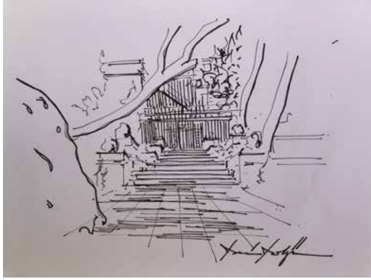
Figür 10 Köşk (Deniz Dokgöz).

Üst kotta kayrak taşları ile döşenmiş bir yola ulaştım. İlerisinde, çalılıkların yanında bir güvercinlik ve ötesinde bir ev vardı. Güvercinlik, tuğla ve taş ile örülmüş bir kule görünümündeydi. Koruda dolaşmak için can atsam da, güvercinlik ve ardındaki köşk beni daha da meraklandırmıştı. Köşke doğru ilerledim. Geniş ve büyük saksılar dizili merdivenlerinden yukarıya çıktım. Kapsında Ahmet Piriştina Sergi Salonu yazıyordu. 2004 yazında yitirdiğimiz İzmir'in en önemli belediye başkanlarından biriydi Piriştina ve adı çok önemli bir yerde, okulun özel bir yer olmasında önemli yeri olan kavramlardan vefa ve bağlılık kavramlarını göstererek karşıma çıkmıştı.